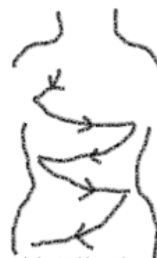
beweeg je vingertop al zigzaggend van boven naar beneden

Beweeg de vingertoppen al zigzaggend van boven naar beneden.