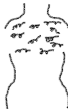
teken met alle vingertoppen tegelijk kronkeltjes bovenaan de rug

Teken met alle vingertoppen tegelijk kronkeltjes bovenaan de rug.