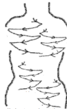
beweeg al je vingertoppen zigzaggend van boven naar beneden

Beweeg de vingertoppen zigzaggend van boven naar beneden.