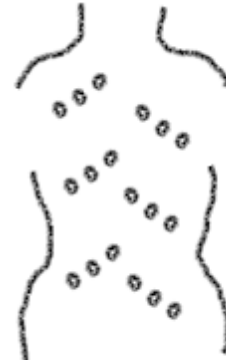
tokkel met de vingers over de rug