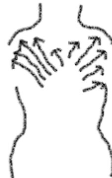
zet beide handen stevig op de rug en wrijf van binnen naar buiten

Zet beide handen stevig op de rug en wrijf van binnen naar buiten.